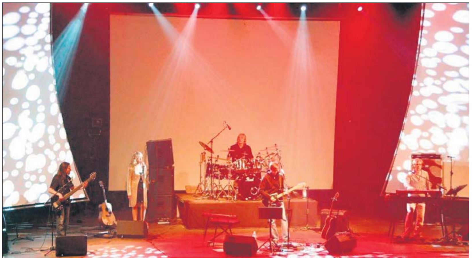
Die vogtländische Band Inside Out interpretierte während ihres fast dreistündigen Konzertes die unvergessenen Klassiker und Meilensteine von Pink Floyd ebenso professionell wie perfektionistisch. Die Laser-Show dürfte zum Besten gehören, was in dieser Hinsicht auf der Parktheaterbühne bisher abging.