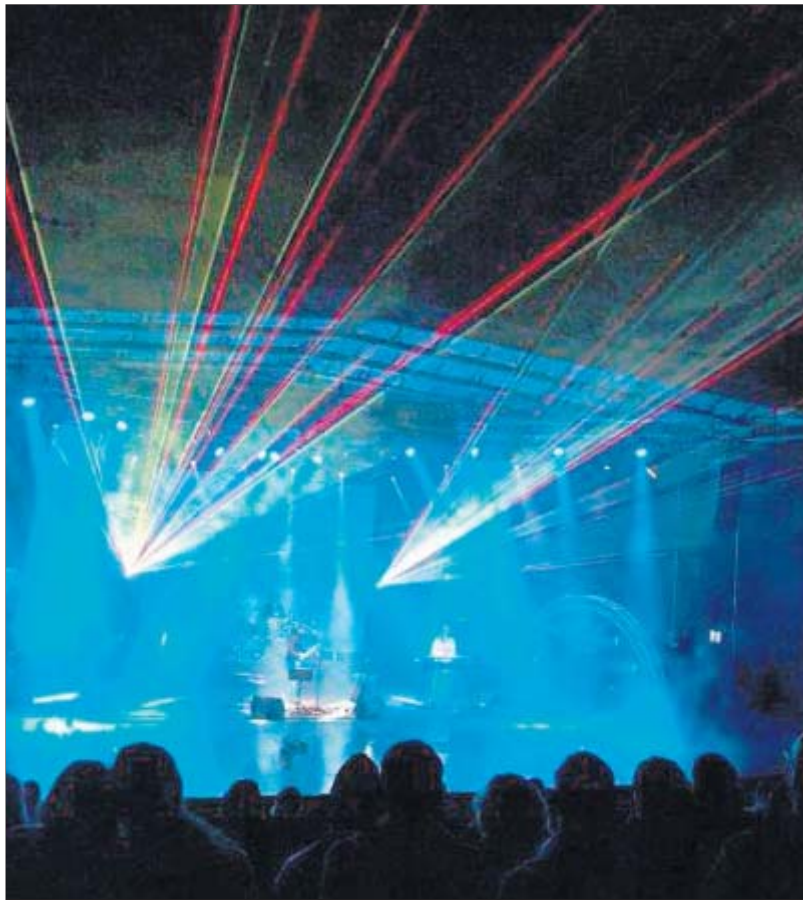
Laserstrahlen schnitten fantasieanregende Muster in den nächtlichen Himmel und selbst die Regentropfen fanden darin einen optisch beeindruckenden Platz.